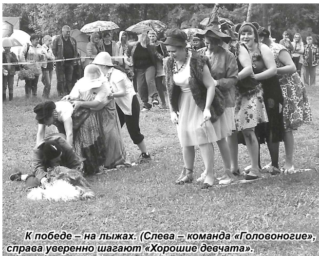
К победе – на лыжах. (Слева – команда «Головоногие», справа уверенно шагают «Хорошие девочки».)