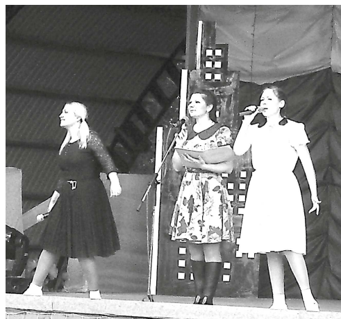
Ведущие одеты по моде – кто в белых носочках, кто в резиновых сапогах.